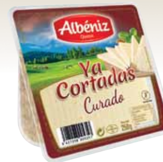
Wedges of matured blended cheese "Ya cortadas" 250g. / Cuña de queso curado "Ya cortadas" 250 g.

CODE / CÓDIGO: 03C2C EAN 13: 8427298005340 Units per case: / Unidad por caja: 12