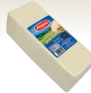
Loaf of semi matured blended cheese / Barra de queso mezcla semicurado

CODE / CÓDIGO: 386 EAN 13: 8427298003582 Units per case: / Unidad por caja: 2