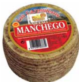
PDO Manchego cheese 3 Months 1 Kg / Queso Manchego D.O. 3 meses 1kg.