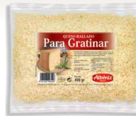
Melted grated cheese 400 g / Rallado de queso gratinar 400 g.