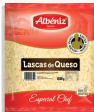
Flakes of frozen cheese 800 g. / Lascas de queso congelado 800 g.

CODE / CÓDIGO: 441 EAN 13: 8427298006224 Units per case: / Unidad por caja: 4