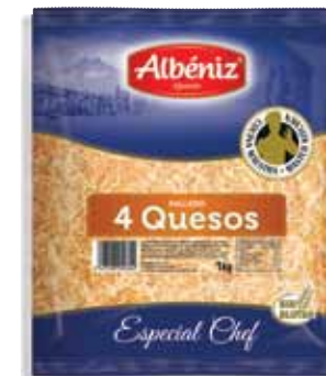
4 cheeses grated cheese 1 Kg / Rallado de 4 quesos 1 kg.