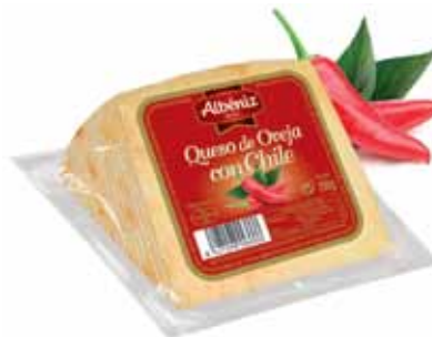
Sheep cheese with chili / Queso de oveja con chile

CODE / CÓDIGO: ? EAN 13: ? Units per case: / Unidad por caja: 12