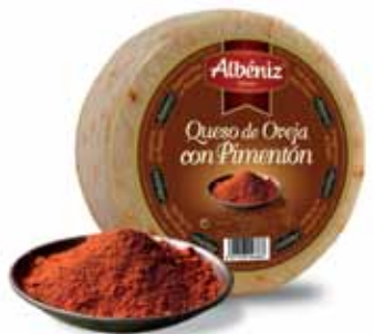
Sheep cheese with pepper / Queso de oveja con pimentón

CODE / CÓDIGO: 602 A EAN 13: 8427298008662 Units per case: / Unidad por caja: 2