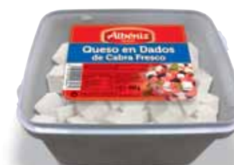
Cubes of fresh frozen goat cheese 500 g. / Dados de queso de cabra fresco congelado 500 g.

CODE / CÓDIGO: M287_800 EAN 13: 8427298007030 Units per case: / Unidad por caja: 6