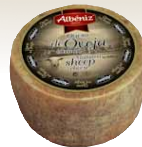
Matured sheep cheese 1.3 Kg / Queso mini de oveja 1,3 kg.