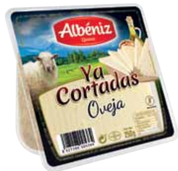
Wedges of sheep cheese "Ya cortadas" 250g. / Cuña de queso oveja "Ya cortadas" 250 g.

CODE / CÓDIGO: 28C2C EAN 13: 8427298005357 Units per case: / Unidad por caja: 12