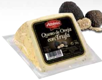
Sheep cheese with truffle / Queso de oveja con trufa

CODE / ? EAN 13: 8427298002103 Units per case: / Unidad por caja: 12