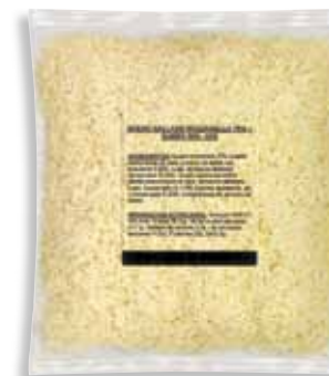
Grated cheese Mozzarella 70% + cheese 30% 1 Kg / Rallado de Mozzarella 70% + queso 30% - 1 kg.