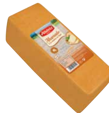
Loaf of cheese lightly smoked / Barra de queso Ahumado

CODE / CÓDIGO: B609 EAN 13: 8427298010535 Units per case: / Unidad por caja: 2