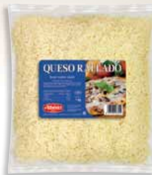
Melted grated cheese 1 Kg / Rallado de queso fundido gratinar 1 kg.