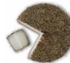
Goat cheese with Thyme / Queso de cabra con tomillo