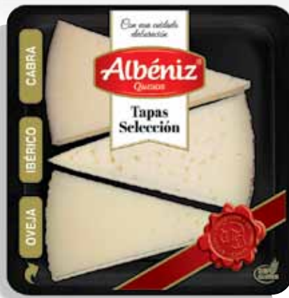
Cheese tapas selection 90 g / Tapas de quesos seleccion 90 g.

Always developping and innovating new formats and presentations in order to make easier the consumption of our dairy products. En continuo desarrollo e innovación de nuevos formatos y presentaciones con el objeto de facilitar el consumo de nuestros productos lácteos.