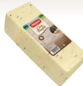
Loaf of cheese with truffle/ Barra de queso con Trufa

CODE / CÓDIGO: B610 EAN 13: 8427298010528 Units per case: / Unidad por caja: 2