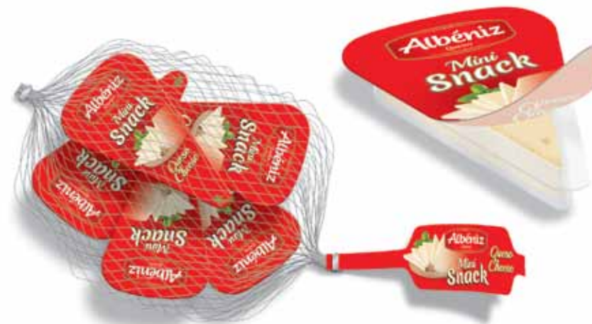
Mini snack 5 Units/Net - 5 Ud/Malla