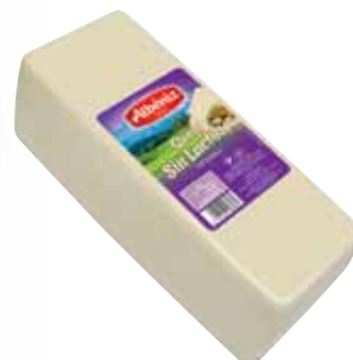
Loaf of cheese without lactose / Barra queso sin lactosa

CODE / CÓDIGO: B415 EAN 13: 8427298006132 Units per case: / Unidad por caja: 2