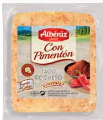
Portion of cheese with Paprika / Taco de queso con Pimentón