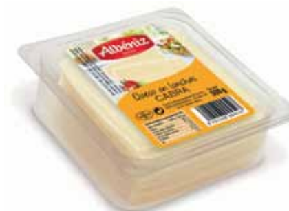
Sliced goat cheese tray 500 g / Loncheado queso de cabra bandeja 500 g.

CODE / CÓDIGO: 305 EAN 13: 8427298004534 Units per case: / Unidad por caja: 10