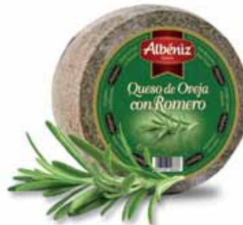
Sheep cheese with rosemary / Queso de oveja con romero

CODE / CÓDIGO: 399 A EAN 13: 8427298008686 Units per case: / Unidad por caja: 2