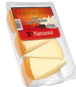
Wedges of sheep cheese V Navarra "Ya cortadas" 300 g. / Cuña de queso oveja V Navarra "Ya cortadas" 300 g.

CODE / CÓDIGO: 58C5C-10 EAN 13: 8427298006026 Units per case: / Unidad por caja: 10