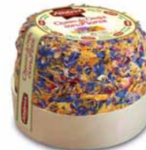
Sheep cheese with flowers / Queso de oveja con flores

CODE / CÓDIGO: ? EAN 13: ? Units per case: / Unidad por caja: 12