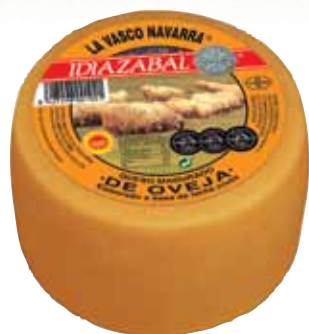
PDO Idiazabal smoked cheese 1.3 Kg / Queso mini D.O. Idiazabal ahum. 1,3 kg.