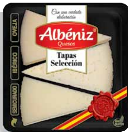
Cheese tapas selection 90 g / Tapas de quesos seleccion 90 g.