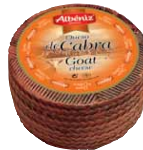
Goat cheese 1 Kg / Queso mini de cabra 1 kg.