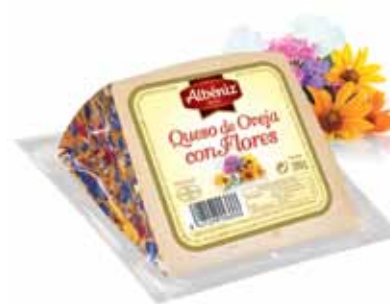
Sheep cheese with flowers / Queso de oveja con flores

CODE / CÓDIGO: ? EAN 13: ? Units per case: / Unidad por caja: 12