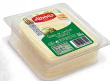
Sliced soft cheese tray 500 g / Loncheado de queso tierno bandeja 500 g.

CODE / CÓDIGO: 439 EAN 13: 8427298006279 Units per case: / Unidad por caja: 10