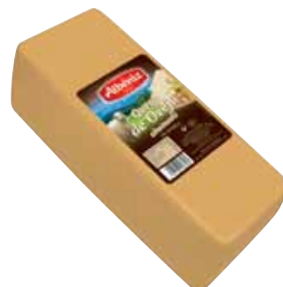
Loaf of smoked sheep cheese / Barra queso de oveja ahumado

CODE / CÓDIGO: B415 EAN 13: 8427298006132 Units per case: / Unidad por caja: 2