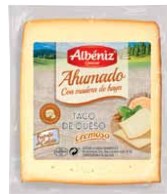
Portion of cheese lightly smoked / Taco de queso Ahumado