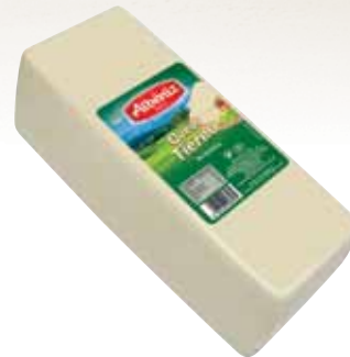
Loaf of soft blended cheese / Barra de queso mezcla tierno

CODE / CÓDIGO: 183 EAN 13: 8427298003414 Units per case: / Unidad por caja: 2