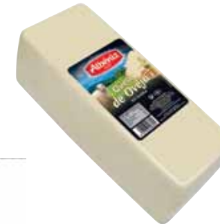
Loaf of sheep cheese / Barra queso de oveja

CODE / CÓDIGO: 193 EAN 13: 8427298005197 Units per case: / Unidad por caja: 2