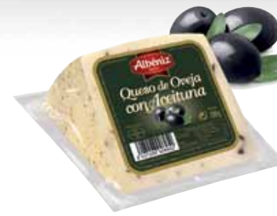
Sheep cheese with olives / Queso de oveja con aceituna

CODE / CÓDIGO: ? EAN 13: 8427298008945 Units per case: / Unidad por caja: 12