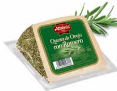
Sheep cheese with rosemary / Queso de oveja con romero

CODE / CÓDIGO: ? EAN 13: 8427298008969 Units per case: / Unidad por caja: 12