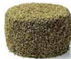
Sheep cheese with rosemary / Queso de oveja con romero