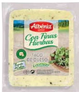
Portion of cheese with fine herbs / Taco de queso con Finas Hierbas