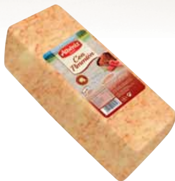
Loaf of cheese with paprika / Barra de queso con Pimentón

CODE / CÓDIGO: B602 EAN 13: 8427298010511 Units per case: / Unidad por caja: 2