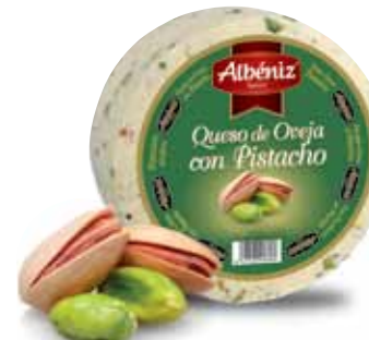
Sheep cheese with pistachio / Queso de oveja con pistacho

CODE / CÓDIGO: ? EAN 13: ? Units per case: / Unidad por caja: 2