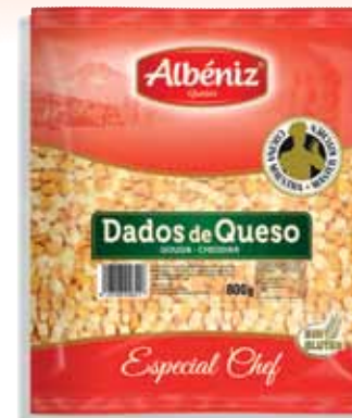
Cubes of frozen cheese 800 g. / Dados de queso congelado 800 g.

CODE / CÓDIGO: RL800 EAN 13: 8427298006194 Units per case: / Unidad por caja: 4