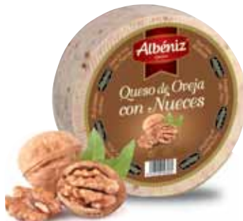
Sheep cheese with walnuts / Queso de oveja con nueces

CODE / CÓDIGO: 601A EAN 13: 8427298009362 Units per case: / Unidad por caja: 2