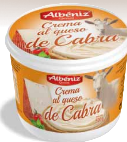
Crema al queso de Cabra 500 g.