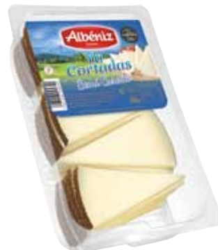
Wedges of semimatured blended cheese "Ya cortadas" 500 g / Cuña de queso semicurado "Ya cortadas" 500 g.

CODE / CÓDIGO: 58C2C EAN 13: 8427298005364 Units per case: / Unidad por caja: 12