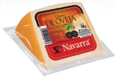
V Navarra smoked sheep cheese / Queso de oveja V Navarra ahum.

Disfrute y deguste nuestras especialidades descubriendo extenso un mundo de sabores y aromas. Enjoy and taste our specialties discovering an huge world of flavors and aromas.