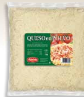
Powder cheese 1 Kg / Rallado de queso en polvo 1 kg.