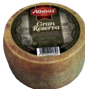
Gran Reserva sheep cheese 1.3 Kg / Queso mini de oveja Gran Reserva 1,2 kg.