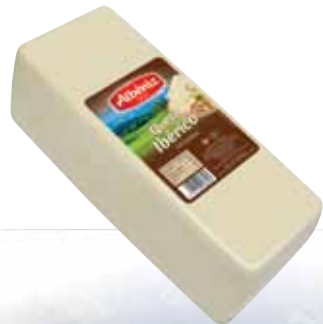
Loaf of Iberico cheese / Barra queso Iberico

CODE / CÓDIGO: 226 EAN 13: 8427298003599 Units per case: / Unidad por caja: 2