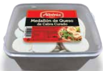
Cheese medallion of frozen goat 500 g. / Medallón de queso de cabra congelado 500 g.

CODE / CÓDIGO: D50GC_800 EAN 13: 8427298006217 Units per case: / Unidad por caja: 4