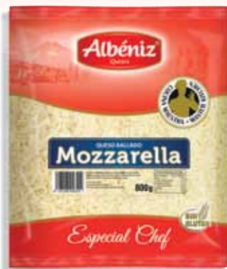
Grated cheese of frozen Mozzarella 800 g. / Queso Rallado de Mozzarella congelado 800 g.

CODE / CÓDIGO: 441 EAN 13: 8427298006224 Units per case: / Unidad por caja: 4