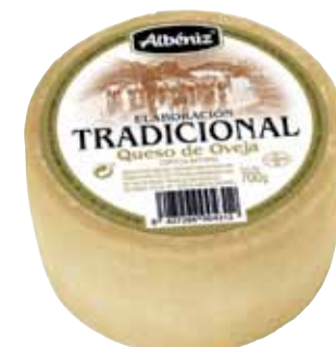
Sheep cheese traditional elaboration 700 g / Queso tradicional de oveja 700 g.