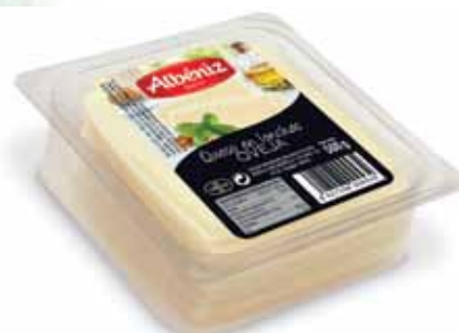
Sliced sheep cheese tray 500 g / Loncheado queso de oveja bandeja 500 g.

CODE / CÓDIGO: 229 EAN 13: 8427298003131 Units per case: / Unidad por caja: 10