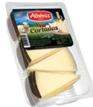
Wedges of sheep cheese "Ya cortadas" 500 g. / Cuña de queso oveja "Ya cortadas" 500 g.

CODE / CÓDIGO: 03C5C-10 EAN 13: 8427298006125 Units per case: / Unidad por caja: 10