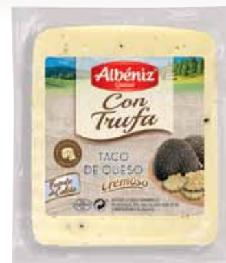
Portion of cheese with truffle / Taco de queso con Trufa