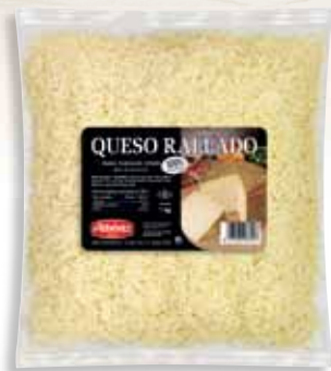
Natural grated cheese 1 Kg / Rallado de queso natural 1 kg.