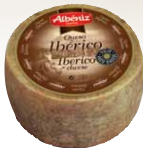
Aged iberico cheese 1.3 Kg / Queso mini ibérico viejo 1,3 kg.