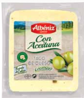
Portion of cheese with olives / Taco de queso con Aceituna