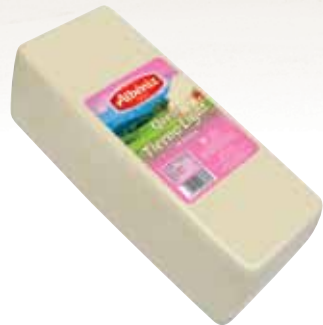
Block light cheese / Barra de queso light

CODE / CÓDIGO: 183 EAN 13: 8427298003414 Units per case: / Unidad por caja: 2