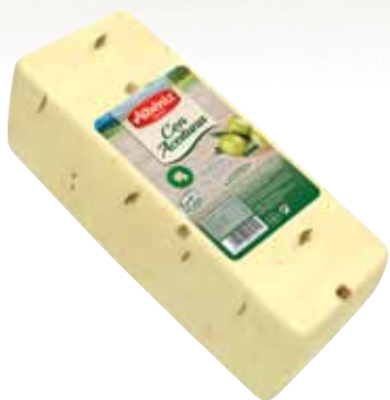
Loaf of cheese with olives / Barra de queso con Aceituna

Weight approximately 3Kg / Peso aproximadamente de 3Kg