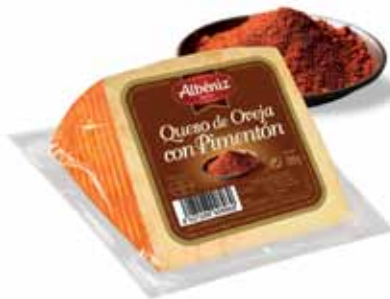
Sheep cheese with pepper / Queso de oveja con pimentón

CODE / CÓDIGO: ? EAN 13: 8427298008952 Units per case: / Unidad por caja: 12