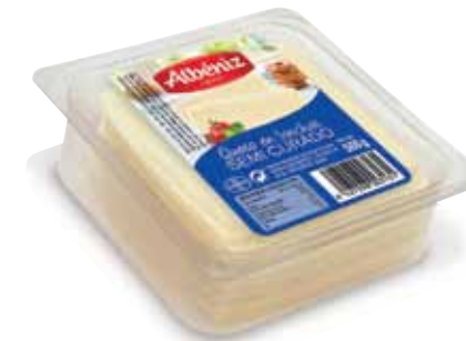
Sliced semi matured blended cheese tray 500 g / Loncheado de queso semicurado bandeja 500 g.

CODE / CÓDIGO: 230 EAN 13: 8427298003124 Units per case: / Unidad por caja: 10