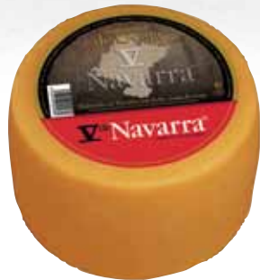
V Navarra smoked sheep cheese 3 Kg / Queso de oveja V Navarra ahum. 3 kg.

Disfrute y deguste nuestras especialidades descubriendo extenso un mundo de sabores y aromas. Enjoy and taste our specialties discovering an huge world of flavors and aromas.