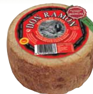
PDO Roncal cheese 1 Kg / Queso mini D.O. Roncal 1 kg.