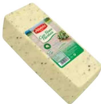
Loaf of cheese with fine herbs / Barra de queso con Finas Hierbas

CODE / CÓDIGO: B609 EAN 13: 8427298010535 Units per case: / Unidad por caja: 2