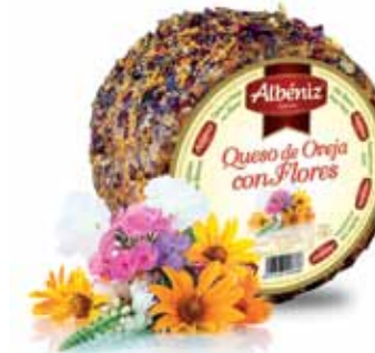
Sheep cheese with flowers / Queso de oveja con flores

CODE / CÓDIGO: 35A EAN 13: 8427298009355 Units per case: / Unidad por caja: 2