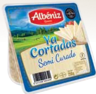
Wedge of semimatured blended cheese "Ya cortadas" 250g / Cuña de queso semicurado "Ya cortadas" 250 g.

CODE / CÓDIGO: 61C2C EAN 13: 8427298005333 Units per case: / Unidad por caja: 12