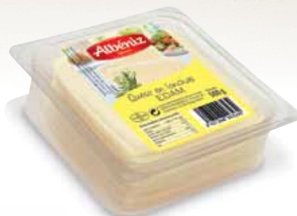
Sliced cheese Edam tray 500 g / Loncheado de queso Edam bandeja 500 g.

CODE / CÓDIGO: 392 EAN 13: 8427298003230 Units per case: / Unidad por caja: 10