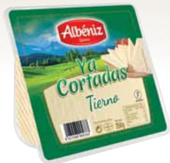
Wedge of soft cheese "Ya cortadas" 250g / Cuña de queso tierno "Ya cortadas" 250 g.

CODE / CÓDIGO: 61C2C EAN 13: 8427298005333 Units per case: / Unidad por caja: 12