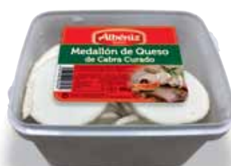
Cheese medallion of frozen goat 800 g. / Medallón de queso de cabra congelado 800 g.

CODE / CÓDIGO: M287_500 EAN 13: 8427298006057 Units per case: / Unidad por caja: 8