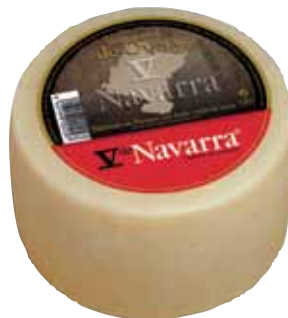
V Navarra natural sheep cheese 1.3 Kg / Queso mini oveja V Navarra nat. 1,3 kg.