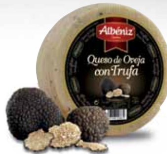
Sheep cheese with truffel / Queso de oveja con trufa

CODE / CÓDIGO: 92 EAN 13: 8427298002080 Units per case: / Unidad por caja: 2