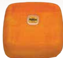
PDO Mahón semi matured cheese / Queso D.O.Mahón