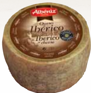
Matured iberico cheese 1.3 Kg / Queso mini ibérico curado 1,3 kg.