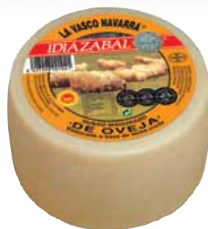
PDO Idiazabal natural cheese 1.3 Kg / Queso mini D.O. Idiazabal nat. 1,3 kg.