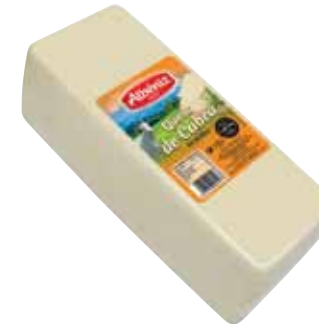
Loaf of goat cheese / Barra queso de cabra

CODE / CÓDIGO: 194 EAN 13: 8427298003605 Units per case: / Unidad por caja: 2