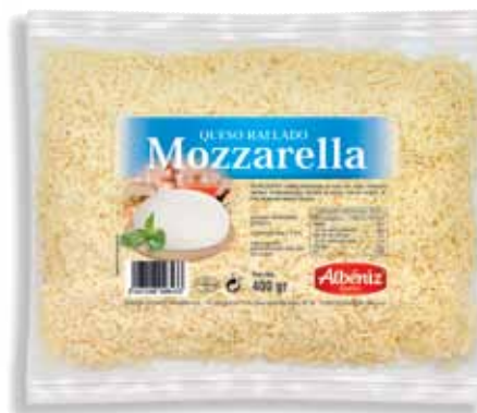
Mozzarella grated cheese 400 g / Rallado de queso Mozzarella 400 g.