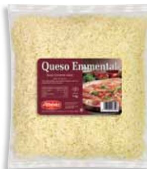
Emmental grated cheese 1 Kg / Rallado de queso Emmental 1 kg.