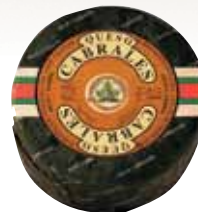
PDO Cabrales blue cheese / Queso D.O. Cabrales