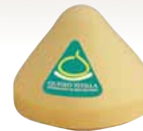
PDO Tetilla cheese / Queso D.O. Tetilla