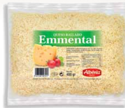
Emmental grated cheese 400 g / Rallado de queso Emmental 400 g.