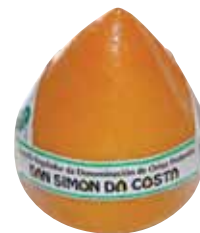
PDO San Simon cheese / Queso D.O. San Simon