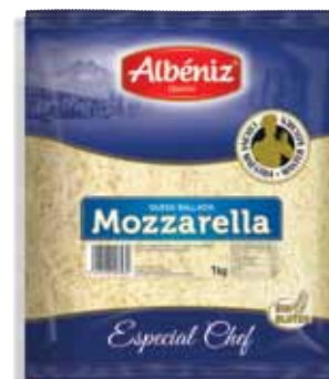
Mozzarella grated cheese 1 Kg / Rallado de queso Mozzarella 1 kg.