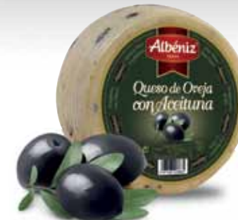
Sheep cheese with olives / Queso de oveja con aceituna

CODE / CÓDIGO: 419 A EAN 13: 8427298008679 Units per case: / Unidad por caja: 2