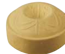
PDO Trochón sheep and goat cheese / Queso de oveja y cabra D.O. Tronchón