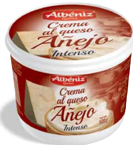
Crema al queso Añejo intenso 500 g.