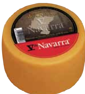
V Navarra smoked sheep cheese 1.3 Kg / Queso mini oveja V Navarra ahum. 1,3 kg.