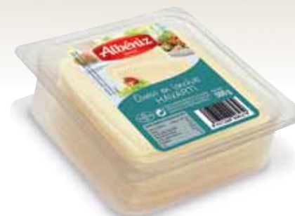
Sliced cheese Havarti tray 500 g / Loncheado de queso Havarti bandeja 500 g.

CODE / CÓDIGO: 392 EAN 13: 8427298003230 Units per case: / Unidad por caja: 10