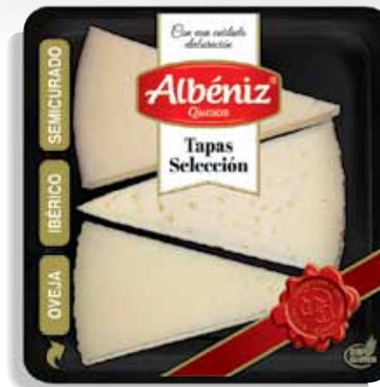
Cheese tapas selection 90 g / Tapas de quesos seleccion 90 g.