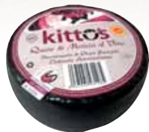
PDO Murcia al vino cheese / Queso D.O. Murcia al vino

We are an integral supplier of cheeses from Spain, giving the possibility to small cheesemakers and their specialties of reaching different corners of the world. Somos un proveedor integral de quesos de España, haciendo posible que pequeños queseros y sus especialidades lleguen a los diferentes rincones del mundo.