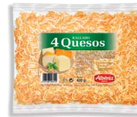
Grated cheese 400 g / Rallado de queso 4 quesos 400 g.