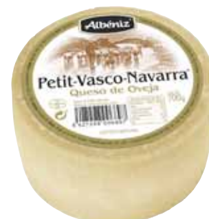
? 700 g / Queso Petit Vasco Navarra 700 g.