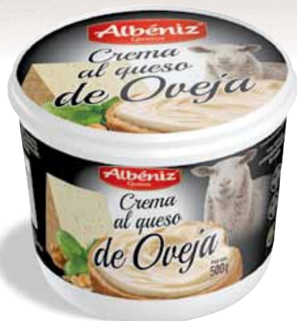
/ Crema al queso de Oveja 500 g.