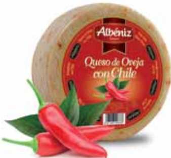
Sheep cheese with chili / Queso de oveja con chile

CODE / CÓDIGO: 608A EAN 13: 8427298009379 Units per case: / Unidad por caja: 2