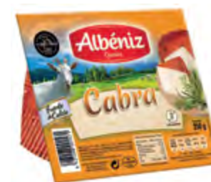
Cuña queso de cabra 250 g. c/exp.

CÓDIGO: 195 EAN 13: 8427298004077 UNIDAD POR CAJA: 2