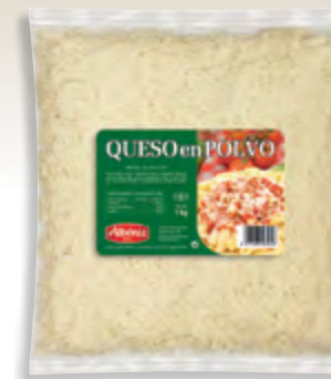
Rallado de queso en polvo 1 kg.

CÓDIGO: 214 EAN 13: 8427298003049 UNIDAD POR CAJA: 4