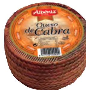
Queso mini de cabra 1 kg.

CÓDIGO: 161 EAN 13: 8427298001328 UNIDAD POR CAJA: 4