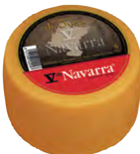
Queso mini oveja V Navarra ahum. 1,3 kg.

CÓDIGO: 73A EAN 13: 8427298000499 UNIDAD POR CAJA: 6