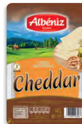
Lonchas de queso Cheddar 85 g. c/exp.

CÓDIGO: L324 EAN 13: 8427298003544 UNIDAD POR CAJA: 16