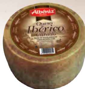
Queso ibérico curado 3 kg.

CÓDIGO: 456 EAN 13: 8427298003803 UNIDAD POR CAJA: 2