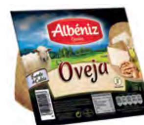
Cuña queso de oveja 250 g. c/exp.

CÓDIGO: 581/4 EAN 13: 8427298004299 UNIDAD POR CAJA: 8