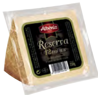
Cuña de queso reserva 12 meses 250 g.