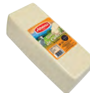
Barra queso de cabra 3 kg.

CÓDIGO: 194 EAN 13: 8427298003605 UNIDAD POR CAJA: 2