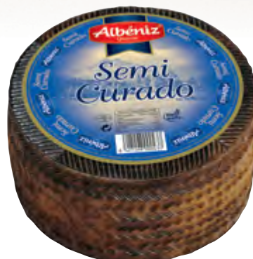
Queso mezcla semicurado 3 kg.