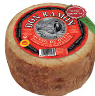
Queso D.O. Roncal 3 kg.