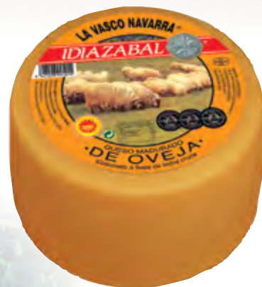
Queso D.O. Idiazabal ahum. 3 kg.