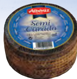
Queso mini mezcla semicurado 900 g.

CÓDIGO: 03 EAN 13: 8427298000437 UNIDAD POR CAJA: 2