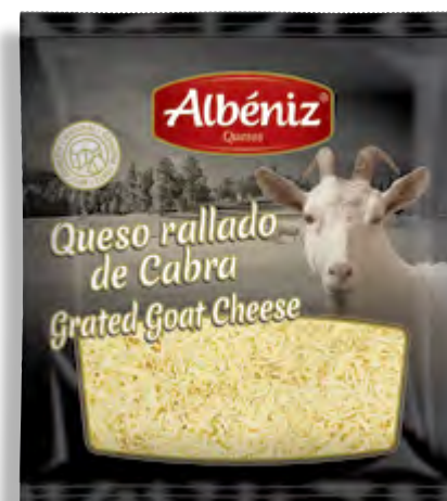
Queso rallado de cabra