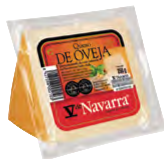
Cuña de queso oveja V Navarra ahum. 250 g.