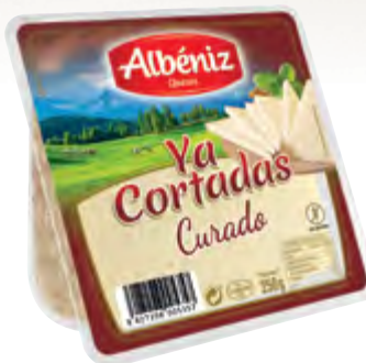
Cuña de queso curado "Ya cortadas" 250 g.

CÓDIGO: 03C2C EAN 13: 8427298005340 UNIDAD POR CAJA: 16