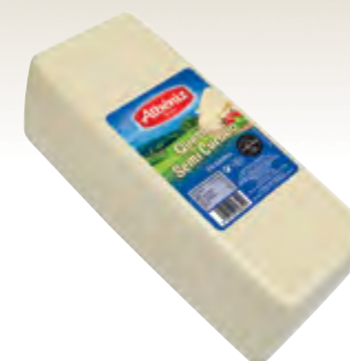
Barra de queso mezcla semicurado 3 kg.

CÓDIGO: 386 EAN 13: 8427298003582 UNIDAD POR CAJA: 2