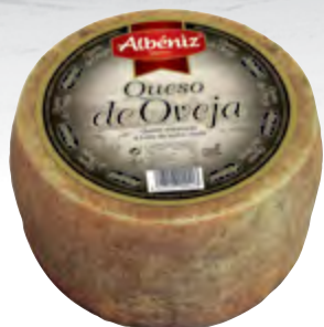
Queso de oveja curado 3 kg.

CÓDIGO: 58 EAN 13: 8427298000413 UNIDAD POR CAJA: 2