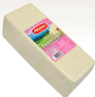
Barra de queso light 3 kg.

CÓDIGO: 183 EAN 13: 8427298003414 UNIDAD POR CAJA: 2