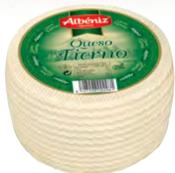
Queso mini mezcla tierno 990 g.