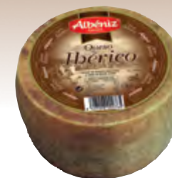
Queso ibérico curado 1,3 kg.

CÓDIGO: 64 EAN 13: 8427298005814 UNIDAD POR CAJA: 2