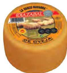
Queso mini D.O. Idiazabal ahum. 1,3 kg.

CÓDIGO: 41 EAN 13: 8427298001014 UNIDAD POR CAJA: 2