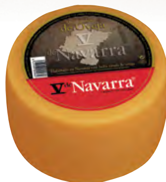
Queso de oveja V Navarra ahum. 3 kg.

CÓDIGO: 160 EAN 13: 8427298001311 UNIDAD POR CAJA: 2