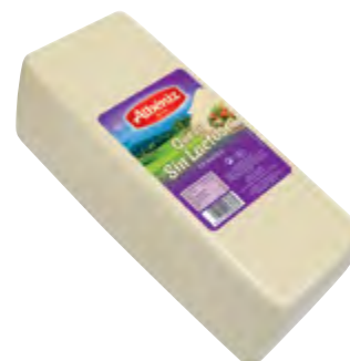
Barra queso sin lactosa 3 kg.

CÓDIGO: B415 EAN 13: 8427298006132 UNIDAD POR CAJA: 2