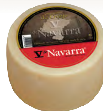
Queso de oveja V Navarra nat. 3 kg.

CÓDIGO: 92 EAN 13: 8427298002080 UNIDAD POR CAJA: 2