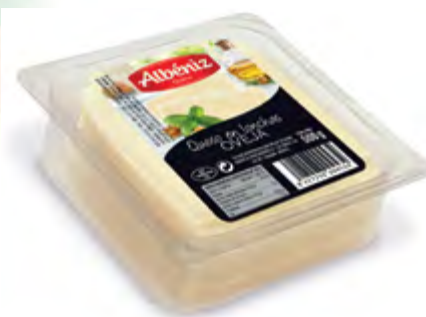
Loncheado queso de oveja bandeja 500 g.

CÓDIGO: 229 EAN 13: 8427298003131 Unidad por caja: 10