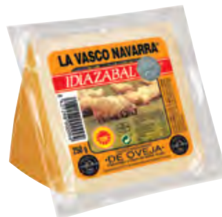
Cuña de queso D.O. Idiazabal ahum. 250 g.