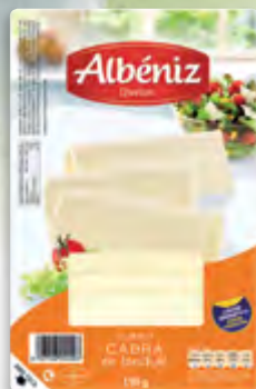
Lonchas queso de cabra 150 g.

CÓDIGO: C74 EAN 13: 8427298001571 UNIDAD POR CAJA: 12