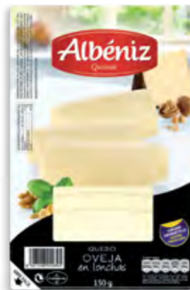
Lonchas queso de oveja 150 g.

CÓDIGO: 154 EAN 13: 8427298002479 UNIDAD POR CAJA: 20