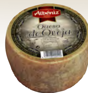
Queso mini de oveja 1,3 kg.

CÓDIGO: 46 EAN 13: 8427298000758 UNIDAD POR CAJA: 4