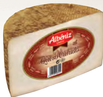
Queso mezcla curado 1/2 piezas ± 1,7 kg.

CÓDIGO: 03M EAN 13: 8427298003148 UNIDAD POR CAJA: 4