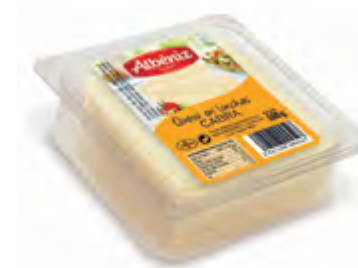
Loncheado queso de cabra bandeja 500 g.

CÓDIGO: L74 EAN 13: 8427298004695 UNIDAD POR CAJA: 16