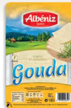
Lonchas de queso Gouda 90 g. c/exp.

CÓDIGO: L321 EAN 13: 8427298003537 UNIDAD POR CAJA: 16