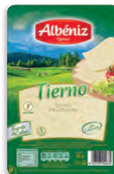
Lonchas de queso tierno 85 g. c/exp.

CÓDIGO: 213 EAN 13: 8427298002486 UNIDAD POR CAJA: 20