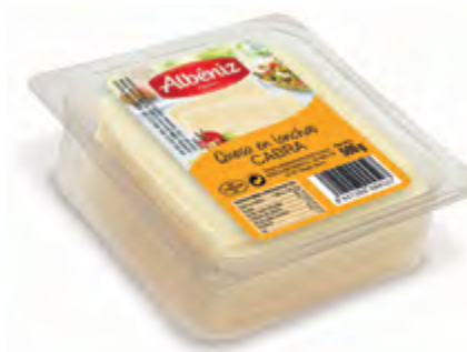
Loncheado queso de cabra bandeja 500 g.

CÓDIGO: 305 EAN 13: 8427298004534 Unidad por caja: 10