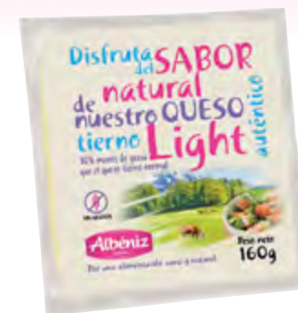
Taco de queso tierno light 160 g.

CÓDIGO: 183 EAN 13: 8427298003414 UNIDAD POR CAJA: 2