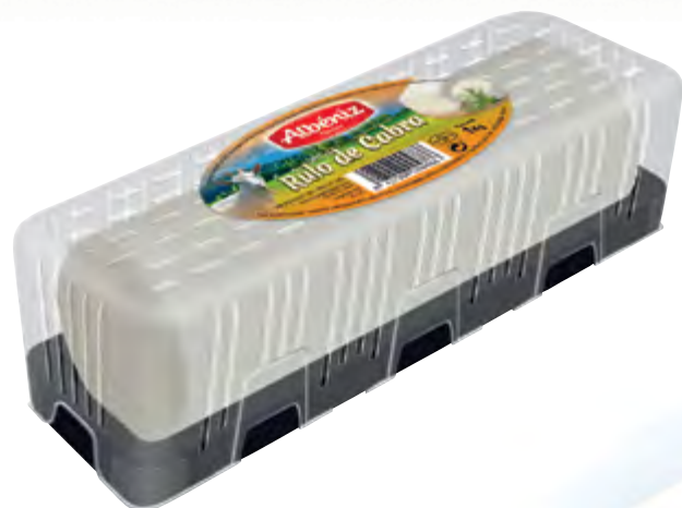
Rulo de cabra 1 kg.