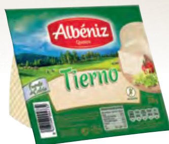
Cuña de queso tierno 250 g. c/exp.

CÓDIGO: C61 EAN 13: 8427298004732 UNIDAD POR CAJA: 12