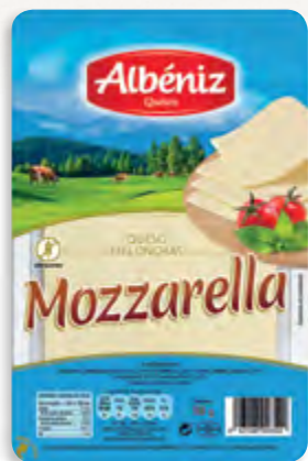
Lonchas de queso Mozzarella 90 g. c/exp.

CÓDIGO: L320 EAN 13: 8427298003520 UNIDAD POR CAJA: 16