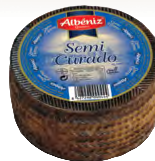
Queso mini mezcla semicurado 700 g.