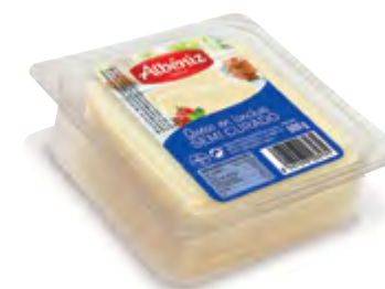
Loncheado de queso semicurado bandeja 500 g.

CÓDIGO: L03 EAN 13: 8427298004688 UNIDAD POR CAJA: 16