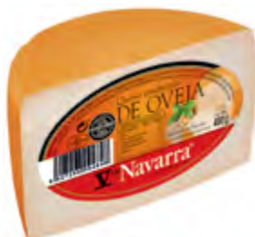
Queso de oveja V Navarra 1/2 piezas 400 g.

CÓDIGO: 95 EAN 13: 8427298002097 UNIDAD POR CAJA: 4