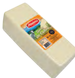
Barra queso de cabra 3 kg.

CÓDIGO: 73A EAN 13: 8427298000499 UNIDAD POR CAJA: 6