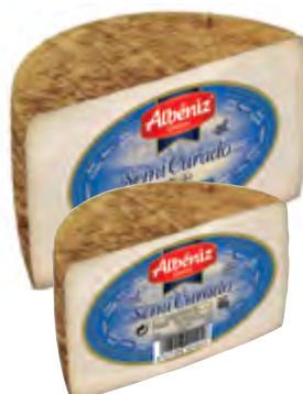
Queso mezcla semicurado 1/2 piezas ± 1,7 kg.

CÓDIGO: 226 EAN 13: 8427298003599 UNIDAD POR CAJA: 2