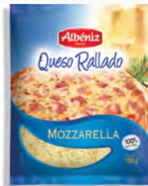
Rallado de queso Mozzarella 150 g.