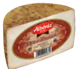
Queso mezcla curado 1/2 piezas 400 g.

CÓDIGO: 28M EAN 13: 8427298003155 UNIDAD POR CAJA: 4