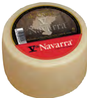
Queso mini oveja V Navarra nat. 1,3 kg.

CÓDIGO: 93 EAN 13: 8427298002097 UNIDAD POR CAJA: 4