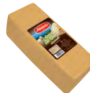
Barra queso de oveja ahumado 3 kg.

CÓDIGO: B415 EAN 13: 8427298006132 UNIDAD POR CAJA: 2