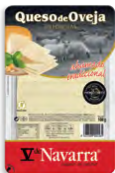
Lonchas de queso oveja V Navarra ahum. 100 g. c/exp.

CÓDIGO: 94C2D EAN 13: 8427298002103 UNIDAD POR CAJA: 12