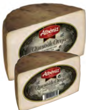
Queso de oveja curado 1/2 piezas ± 1,7 kg.

CÓDIGO: 194 EAN 13: 8427298003605 UNIDAD POR CAJA: 2