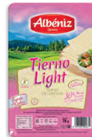
Lonchas de queso tierno light 75 g. c/exp.

CÓDIGO: 216 EAN 13: 8427298002776 UNIDAD POR CAJA: 20