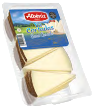
Cuña de queso semicurado "Ya cortadas" 500 g.

CÓDIGO: 58C2C EAN 13: 8427298005364 UNIDAD POR CAJA: 16