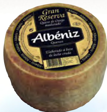
Queso de oveja Gran Reserva 3 kg.

CÓDIGO: 160 EAN 13: 8427298001311 UNIDAD POR CAJA: 2