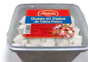
Dados de queso de cabra fresco congelado 500 g.

CÓDIGO: M287_800 EAN 13: 8427298007030 UNIDAD POR CAJA: 6