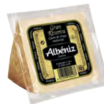
Cuña queso de oveja Gran Reserva 250 g.

CÓDIGO: 1601/4 EAN 13: 8427298001328 UNIDAD POR CAJA: 8