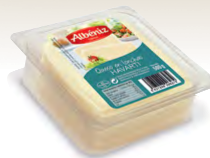
Loncheado de queso Havarti bandeja 500 g.

CÓDIGO: 392 EAN 13: 8427298003230 Unidad por caja: 10