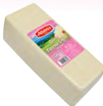
Barra de queso light 3 kg.

CÓDIGO: C183 EAN 13: 8427298004749 UNIDAD POR CAJA: 12