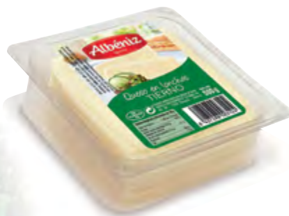
Loncheado de queso tierno bandeja 500 g.

CÓDIGO: 439 EAN 13: 8427298006279 Unidad por caja: 10