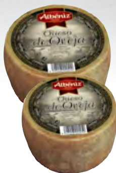
Queso mini de oveja 1,3 kg.

CÓDIGO: 58 EAN 13: 8427298000413 UNIDAD POR CAJA: 2