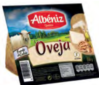
Cuña de queso oveja 250 g. c/exp.

CÓDIGO: C28 EAN 13: 8427298001205 UNIDAD POR CAJA: 12