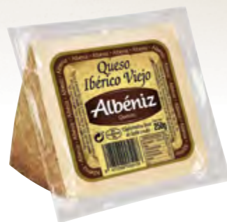
Cuña de queso ibérico viejo 250 g.