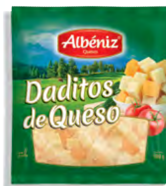
Daditos de Queso Gouda y Cheddar 100 g.

CÓDIGO: RL1 EAN 13: 8427298005982 UNIDAD POR CAJA: 4