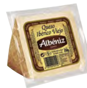
Cuña de queso ibérico viejo 250 g.

CÓDIGO: C64 EAN 13: 8427298003810 UNIDAD POR CAJA: 12