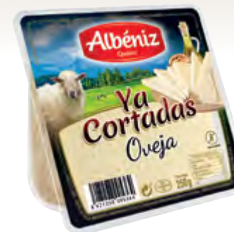
Cuña de queso oveja "Ya cortadas" 250 g.

CÓDIGO: 28C2C EAN 13: 8427298005357 UNIDAD POR CAJA: 16