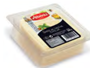
Loncheado queso de oveja bandeja 500 g.

CÓDIGO: L58 EAN 13: 8427298004725 UNIDAD POR CAJA: 16