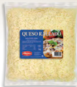
Rallado de queso fundido gratinar 1 kg.

CÓDIGO: 243 EAN 13: 8427298003223 UNIDAD POR CAJA: 4