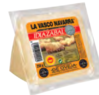
Cuña de queso D.O. Idiazabal nat. 250 g.