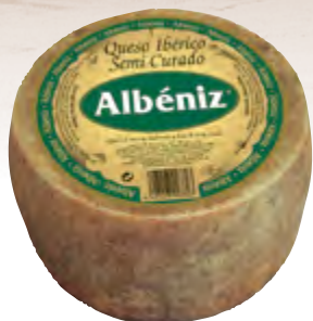
Queso ibérico semicurado 3 kg.

CÓDIGO: 456 EAN 13: 8427298003803 UNIDAD POR CAJA: 2