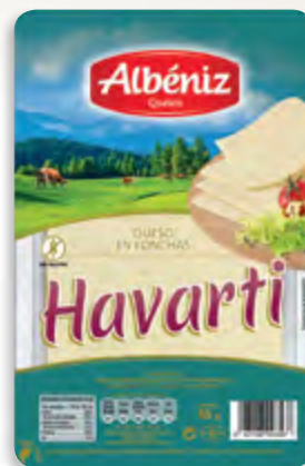
Lonchas de queso Havarti 85 g. c/exp.

CÓDIGO: L320 EAN 13: 8427298003520 UNIDAD POR CAJA: 16