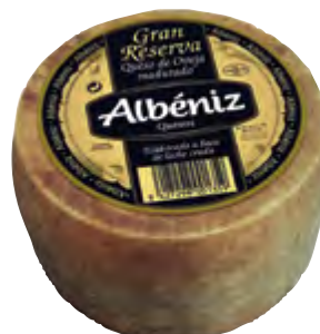
Queso mini de oveja Gran Reserva 1,2 kg.

CÓDIGO: 57 EAN 13: 8427298000420 UNIDAD POR CAJA: 4