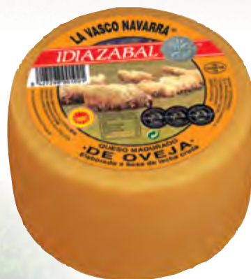
Queso mini D.O. Idiazabal ahum. 1,3 kg.

CÓDIGO: 44 EAN 13: 8427298001021 UNIDAD POR CAJA: 4