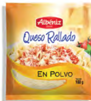
Rallado de queso en polvo 100 g.