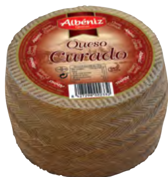
Queso mini mezcla curado 840 g.