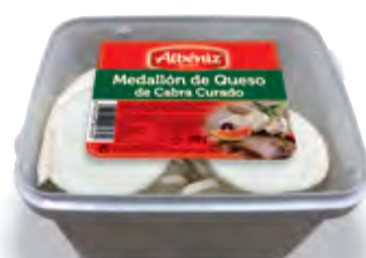
Medallón de queso de cabra congelado 800 g.

CÓDIGO: M287_500 EAN 13: 8427298006057 UNIDAD POR CAJA: 8