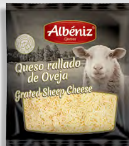
Queso rallado de oveja