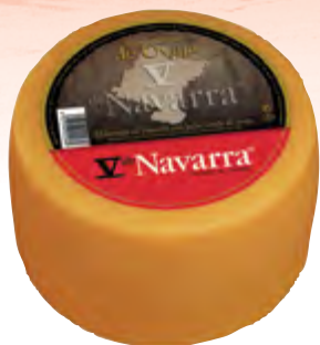
Queso de oveja V Navarra ahum. 3 kg.

CÓDIGO: 92 EAN 13: 8427298002080 UNIDAD POR CAJA: 2