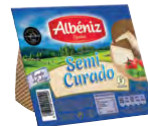
Cuña de queso semicurado 250 g. c/exp.

CÓDIGO: 031/4 EAN 13: 8427298004251 UNIDAD POR CAJA: 8