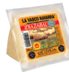
Cuña de queso D.O. Idiazabal nat. 250 g

CÓDIGO: 43C2V12 EAN 13: 8427298000994 UNIDAD POR CAJA: 12