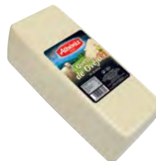
Barra queso de oveja 3 kg.

CÓDIGO: 193 EAN 13: 8427298005197 UNIDAD POR CAJA: 2