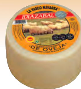
Queso D.O. Idiazabal nat. 3 kg.

CÓDIGO: 43 EAN 13: 8427298001014 UNIDAD POR CAJA: 2