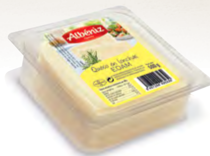
Loncheado de queso Edam bandeja 500 g.

CÓDIGO: 392 EAN 13: 8427298003230 Unidad por caja: 10