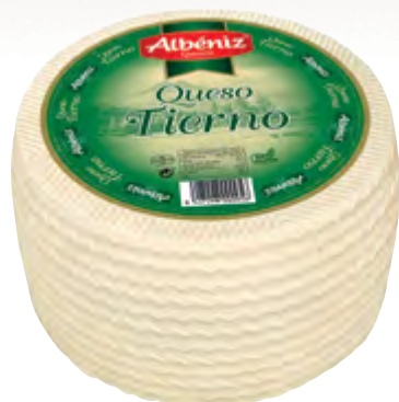
Queso mezcla tierno vacío 3 kg.