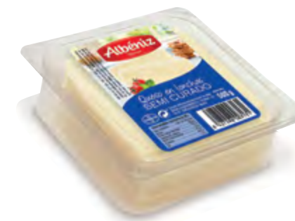
Loncheado de queso semicurado bandeja 500 g.

CÓDIGO: 230 EAN 13: 8427298003124 Unidad por caja: 10