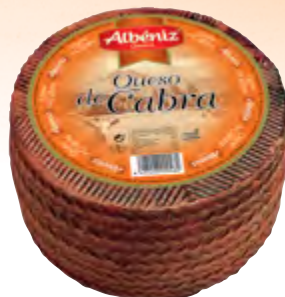
Queso de cabra 3 kg.

CÓDIGO: 74 EAN 13: 8427298000482 UNIDAD POR CAJA: 2