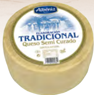
Queso tradicional semicurado 3 kg.

CÓDIGO: T03 EAN 13: 8427298005852 UNIDAD POR CAJA: 2