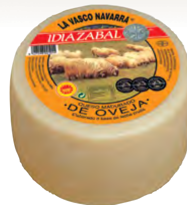
Queso D.O. Idiazabal nat. 3 kg.