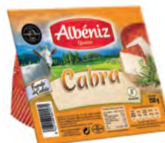
Cuña de queso cabra 250 g. c/exp.

CÓDIGO: C58 EAN 13: 8427298001427 UNIDAD POR CAJA: 12