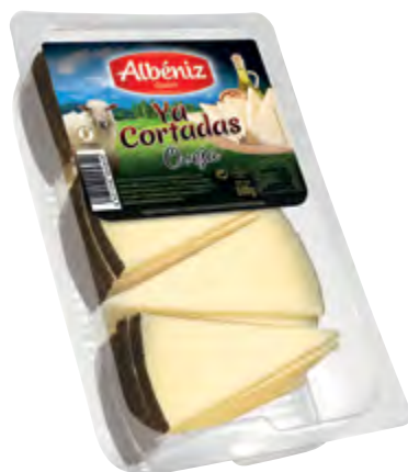
Cuña de queso oveja "Ya cortadas" 500 g.

CÓDIGO: 03C5C-10 EAN 13: 8427298006125 UNIDAD POR CAJA: 10