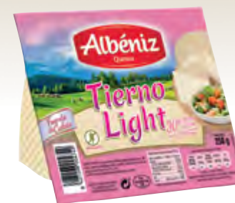
Cuña de queso tierno light 250 g. c/exp.

CÓDIGO: C61 EAN 13: 8427298004732 UNIDAD POR CAJA: 12