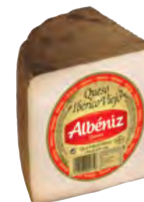
Queso ibérico viejo 1/4 ± 800 g.

CÓDIGO: 46 EAN 13: 8427298000758 UNIDAD POR CAJA: 4