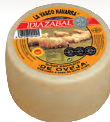
Queso mini D.O. Idiazabal nat. 1,3 kg.

CÓDIGO: 44 EAN 13: 8427298001021 UNIDAD POR CAJA: 4