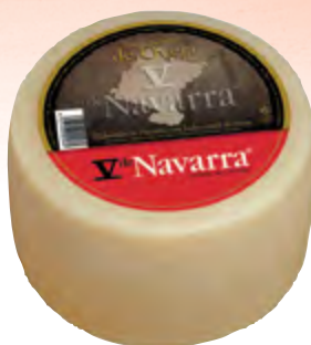
Queso de oveja V Navarra nat. 3 kg.

CÓDIGO: 92 EAN 13: 8427298002080 UNIDAD POR CAJA: 2