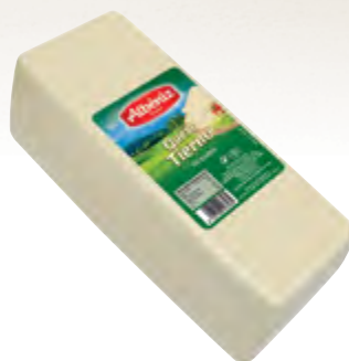
Barra de queso mezcla tierno 3 kg.

CÓDIGO: 183 EAN 13: 8427298003414 UNIDAD POR CAJA: 2