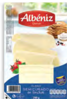
Lonchas de queso semicurado 200 g.

CÓDIGO: C03 EAN 13: 8427298001199 UNIDAD POR CAJA: 12