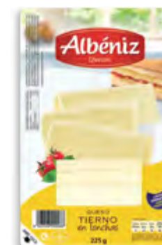
lonchas de queso tierno 225 g.

CÓDIGO: C61 EAN 13: 8427298004732 UNIDAD POR CAJA: 12