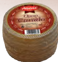
Queso mini mezcla curado 840 g.

CÓDIGO: 28 EAN 13: 8427298000451 UNIDAD POR CAJA: 2