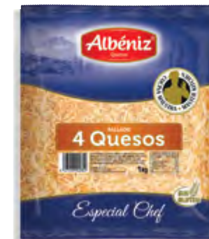
Rallado de 4 quesos 1 kg.

CÓDIGO: 10 EAN 13: 8427298003032 UNIDAD POR CAJA: 4