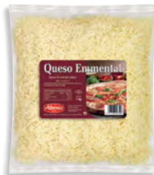
Rallado de queso Emmental 1 kg.

CÓDIGO: 238 EAN 13: 8427298003056 UNIDAD POR CAJA: 4