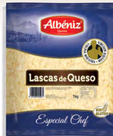
Lascas de queso 1 kg.

CÓDIGO: RL100 EAN 13: 8427298005951 UNIDAD POR CAJA: 16