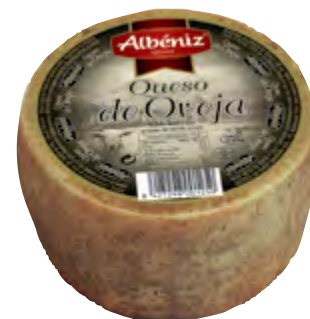
Queso mini de oveja 700 g.