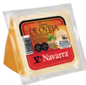
Cuña de queso oveja V Navarra ahum. 250 g.

CÓDIGO: 938M EAN 13: 8427298004848 UNIDAD POR CAJA: 12