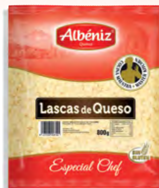
Lascas de queso congelado 800 g.

CÓDIGO: 441 EAN 13: 8427298006224 UNIDAD POR CAJA: 4