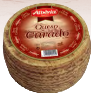
Queso mezcla curado 3 kg.

CÓDIGO: 28 EAN 13: 8427298000451 UNIDAD POR CAJA: 2