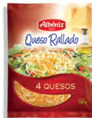
Rallado de 4 quesos 150 g.