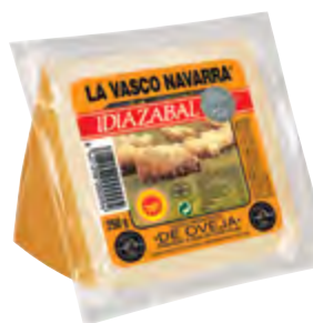
Cuña de queso D.O. Idiazabal ahum. 250 g.

CÓDIGO: 42 EAN 13: 8427298001021 UNIDAD POR CAJA: 4