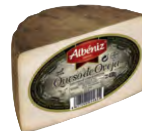
Queso de oveja curado 1/2 piezas 400 g.

CÓDIGO: 211 M EAN 13: 8427298004831 UNIDAD POR CAJA: 12