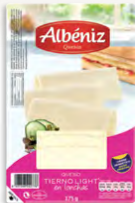
Lonchas de queso tierno light 175 g.

CÓDIGO: 216 EAN 13: 8427298002776 UNIDAD POR CAJA: 20