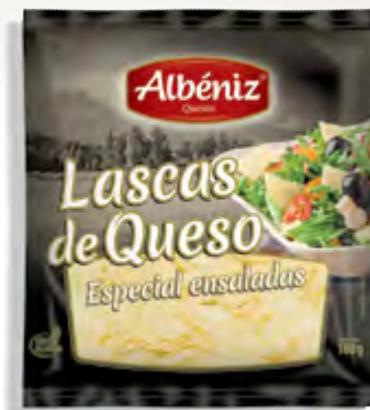
Lascas de queso 100 g.

CÓDIGO: RL100 EAN 13: 8427298005951 UNIDAD POR CAJA: 16