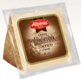
Cuña de queso ibérico curado 250 g.