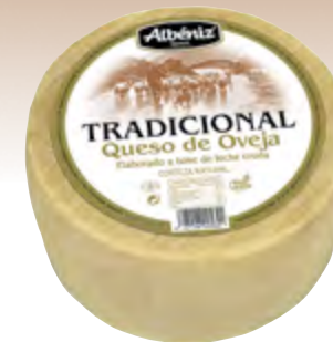
Queso tradicional de oveja 3 kg.

CÓDIGO: T28 EAN 13: 8427298005876 UNIDAD POR CAJA: 2