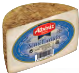
Queso mezcla semicurado 1/2 piezas 400 g.

CÓDIGO: 58M EAN 13: 8427298004046 UNIDAD POR CAJA: 4