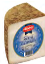
Queso mezcla semicurado 1/4 ± 800 g.

CÓDIGO: 08M EAN 13: 8427298004916 UNIDAD POR CAJA: 12