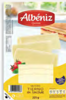
lonchas de queso tierno 225 g.

CÓDIGO: 216 EAN 13: 8427298002776 UNIDAD POR CAJA: 20