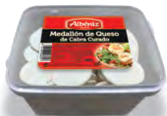
Medallón de queso de cabra congelado 500 g.

CÓDIGO: D50GC_800 EAN 13: 8427298006217 UNIDAD POR CAJA: 4