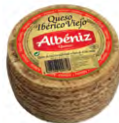
Queso ibérico viejo 1,3 kg.

CÓDIGO: 40 EAN 13: 8427298000710 UNIDAD POR CAJA: 2