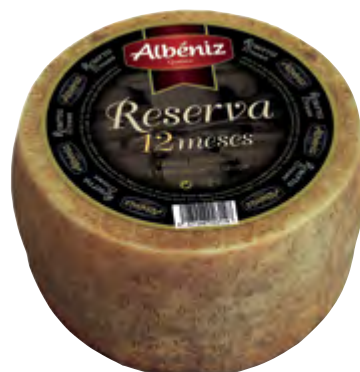
Queso Reserva 12 meses 3 kg.

CÓDIGO: 310 EAN 13: 8427298000314 UNIDAD POR CAJA: 2