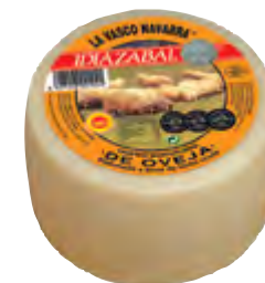
Queso mini D.O. Idiazabal nat. 1,3 kg.

CÓDIGO: 44 EAN 13: 8427298001021 UNIDAD POR CAJA: 4