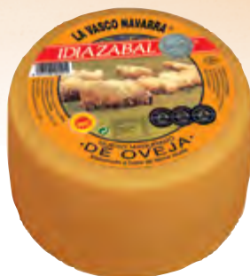
Queso D.O. Idiazabal ahum. 3 kg.

CÓDIGO: 43 EAN 13: 8427298001014 UNIDAD POR CAJA: 2