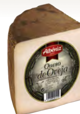
Queso de oveja curado 1/4 ± 800 g.

CÓDIGO: 281/4 EAN 13: 8427298004244 UNIDAD POR CAJA: 8