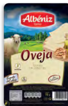
Lonchas queso de oveja 70 g. c/exp.

CÓDIGO: 217 EAN 13: 8427298000895 UNIDAD POR CAJA: 20