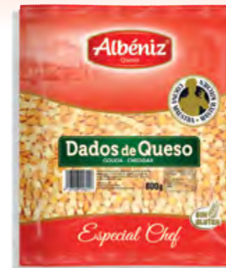
Dados de queso congelado 800 g.

CÓDIGO: RL800 EAN 13: 8427298006194 UNIDAD POR CAJA: 4