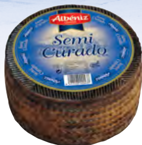
Queso mezcla semicurado 3 kg.

CÓDIGO: 03 EAN 13: 8427298000437 UNIDAD POR CAJA: 2