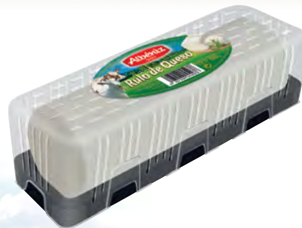
Rulo de queso 850 g.