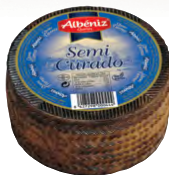
Queso mini mezcla semicurado 900 g.