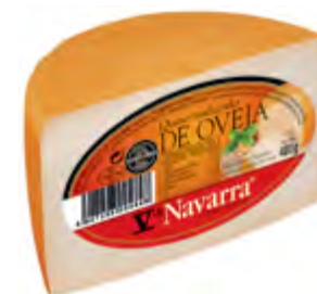
Queso de oveja V Navarra 1/2 piezas 400 g.

CÓDIGO: 212M EAN 13: 8427298004824 UNIDAD POR CAJA: 12