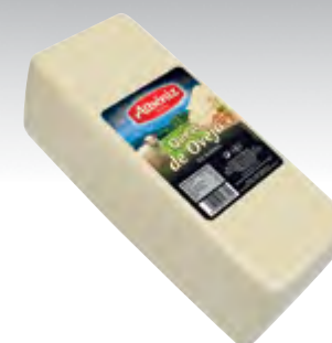
Barra queso de oveja 3 kg.

CÓDIGO: 212A EAN 13: 8427298001250 UNIDAD POR CAJA: 6