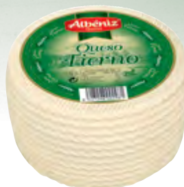
Queso mini mezcla tierno 990 g.

CÓDIGO: 61 EAN 13: 8427298000956 UNIDAD POR CAJA: 2