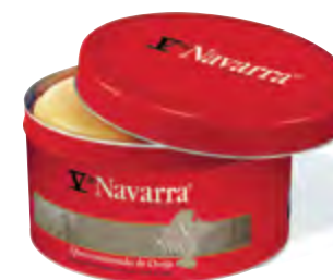
Cuña de queso oveja V Navarra 800 g. est. metálico

CÓDIGO: 92C2L EAN 13: 8427298002288 UNIDAD POR CAJA: 22