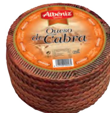
Queso de cabra 3 kg.

CÓDIGO: 310 EAN 13: 8427298000314 UNIDAD POR CAJA: 2