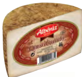
Queso mezcla curado 1/2 piezas 400 g.

CÓDIGO: 08M EAN 13: 8427298004916 UNIDAD POR CAJA: 12