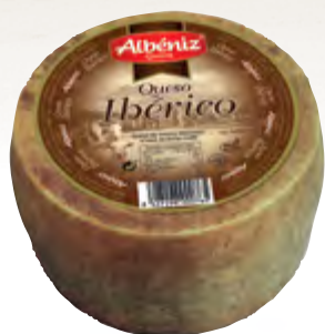
Queso ibérico curado 1,3 kg.

CÓDIGO: 65 EAN 13: 8427298000765 UNIDAD POR CAJA: 4