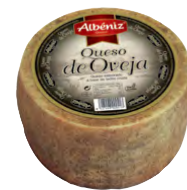
Queso de oveja curado 3 kg.