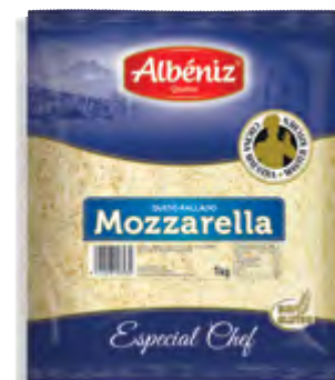
Rallado de queso Mozzarella 1 kg.

CÓDIGO: 297 EAN 13: 8427298005135 UNIDAD POR CAJA: 4