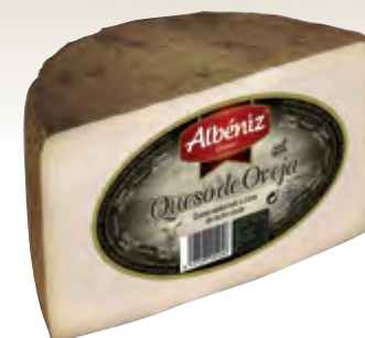
Queso de oveja curado 1/2 piezas ± 1,7 kg.

CÓDIGO: 28M EAN 13: 8427298003155 UNIDAD POR CAJA: 4