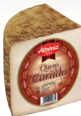
Queso mezcla curado 1/4 ± 800 g.

CÓDIGO: 031/4 EAN 13: 8427298004251 UNIDAD POR CAJA: 8