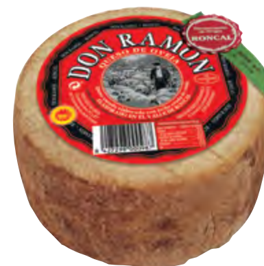
Queso mini D.O. Roncal 1 kg.

CÓDIGO: 42 EAN 13: 8427298001021 UNIDAD POR CAJA: 4