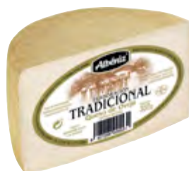
Queso tradicional de oveja 1/2 piezas ± 350 g.

CÓDIGO: T74 EAN 13: 8427298005913 UNIDAD POR CAJA: 2