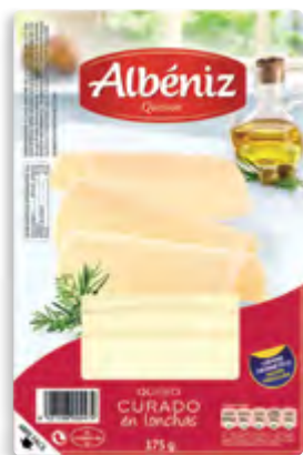
Lonchas de queso curado 175 g.

CÓDIGO: 153 EAN 13: 8427298002462 UNIDAD POR CAJA: 20