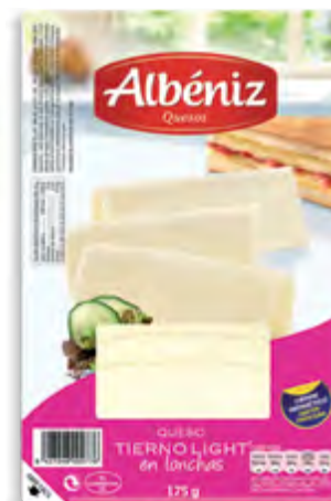
lonchas de queso tierno light 175 g.

CÓDIGO: 216 EAN 13: 8427298002776 UNIDAD POR CAJA: 20