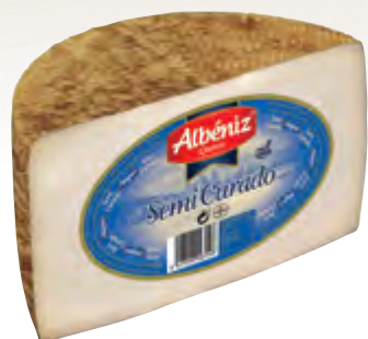
Queso mezcla semicurado 1/2 piezas ± 1,7 kg.

CÓDIGO: 03M EAN 13: 8427298003148 UNIDAD POR CAJA: 4