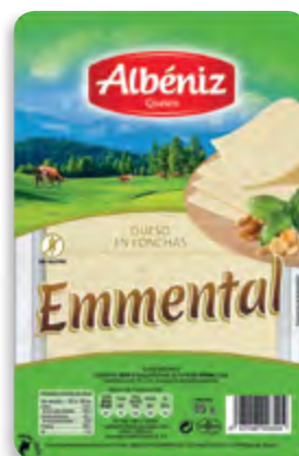
Lonchas de queso Emmental 85 g. c/exp.

CÓDIGO: L323 EAN 13: 8427298003551 UNIDAD POR CAJA: 16