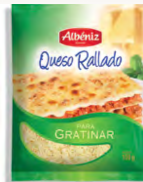
Rallado de queso fundido gratinar 150 g.