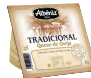
Cuña de queso tradicional de oveja 250 g.

CÓDIGO: CT03 EAN 13: 8427298005869 UNIDAD POR CAJA: 12