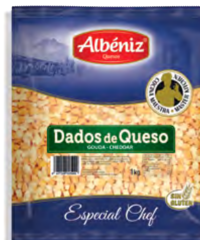
Daditos de Queso Gouda y Cheddar 1 kg.

CÓDIGO: D50GC100 EAN 13: 8427298005968 UNIDAD POR CAJA: 16