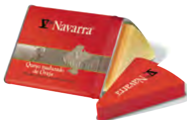
Cuña de queso oveja V Navarra 250 g. est. metálico

CÓDIGO: 92L100 EAN 13: 8427298004565 UNIDAD POR CAJA: 14