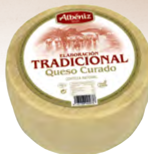
Queso tradicional curado 3 kg.

CÓDIGO: T03 EAN 13: 8427298005852 UNIDAD POR CAJA: 2