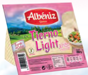
Cuña de queso tierno light 250 g. c/exp.

CÓDIGO: C183 EAN 13: 8427298004749 UNIDAD POR CAJA: 12