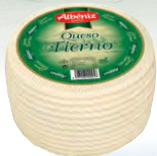
Queso mezcla tierno vacío 3 kg.

CÓDIGO: 61 EAN 13: 8427298000956 UNIDAD POR CAJA: 2