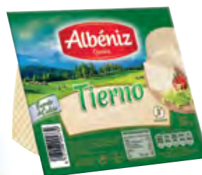
Cuña de queso tierno 250 g. c/exp.

CÓDIGO: 386 EAN 13: 8427298003582 UNIDAD POR CAJA: 2