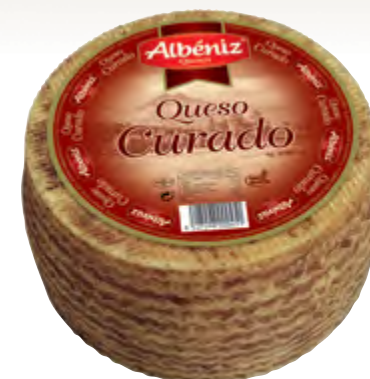
Queso mezcla curado 3 kg.