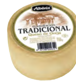
Queso tradicional de oveja 700 g.

CÓDIGO: 306M EAN 13: 8427298005531 UNIDAD POR CAJA: 12