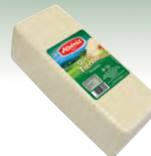
Barra de queso mezcla tierno 3 kg.

CÓDIGO: 210 EAN 13: 8427298002981 UNIDAD POR CAJA: 6