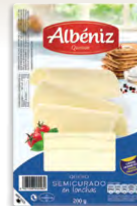
Lonchas de queso semicurado 200 g.

CÓDIGO: 213 EAN 13: 8427298002486 UNIDAD POR CAJA: 20