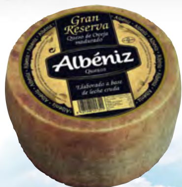
Queso de oveja Gran Reserva 3 kg.

CÓDIGO: 160 EAN 13: 8427298001311 UNIDAD POR CAJA: 2