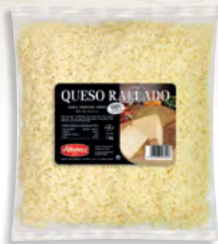
Rallado de queso natural 1 kg.

CÓDIGO: 243 EAN 13: 8427298003223 UNIDAD POR CAJA: 4