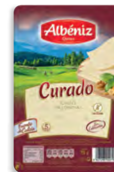
Lonchas de queso curado 75 g. c/exp.

CÓDIGO: 154 EAN 13: 8427298002479 UNIDAD POR CAJA: 20