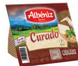
Cuña de queso curado 250 g. c/exp.

CÓDIGO: 281/4 EAN 13: 8427298004244 UNIDAD POR CAJA: 8