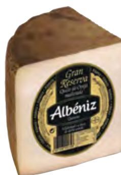
Queso de oveja Gran Reserva 1/4 ± 800 g.

CÓDIGO: 1601/4 EAN 13: 8427298001328 UNIDAD POR CAJA: 8