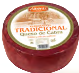
Queso tradicional de cabra 2,5 kg.

CÓDIGO: T58 EAN 13: 8427298005890 UNIDAD POR CAJA: 2