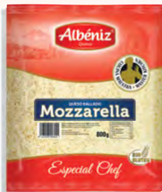
Queso Rallado de Mozzarella congelado 800 g.

CÓDIGO: 441 EAN 13: 8427298006224 UNIDAD POR CAJA: 4