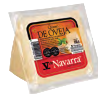
Cuña de queso oveja V Navarra nat. 250 g.