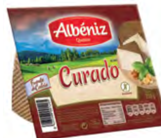
Cuña de queso curado 250 g. c/exp.

CÓDIGO: C03 EAN 13: 8427298001199 UNIDAD POR CAJA: 12