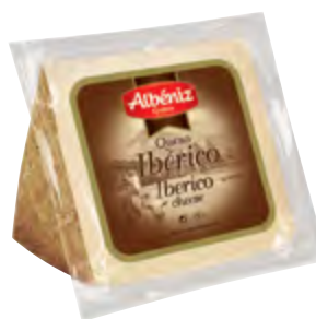
Cuña de queso ibérico curado 250 g.

CÓDIGO: 193 EAN 13: 8427298005197 UNIDAD POR CAJA: 2