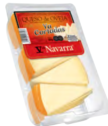
Cuña de queso oveja V Navarra "Ya cortadas" 300 g.

CÓDIGO: 58C5C-10 EAN 13: 8427298006026 UNIDAD POR CAJA: 10