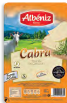
Lonchas queso de cabra 65 g. c/exp.

CÓDIGO: 218 EAN 13: 8427298002493 UNIDAD POR CAJA: 20