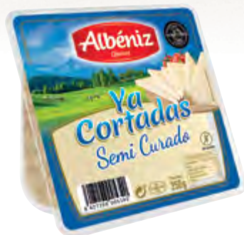
Cuña de queso semicurado "Ya cortadas" 250 g.

CÓDIGO: 03C2C EAN 13: 8427298005340 UNIDAD POR CAJA: 16