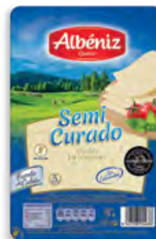
Lonchas de queso semicurado 75 g. c/exp.

CÓDIGO: 153 EAN 13: 8427298002462 UNIDAD POR CAJA: 20