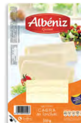
Lonchas queso de cabra 150 g.

CÓDIGO: 217 EAN 13: 8427298000895 UNIDAD POR CAJA: 20