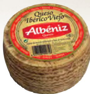
Queso ibérico viejo 1,3 kg.

CÓDIGO: 65 EAN 13: 8427298000765 UNIDAD POR CAJA: 4