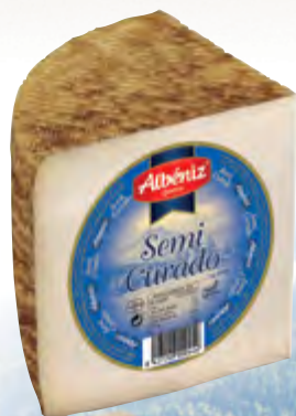
Queso mezcla semicurado 1/4 ± 800 g.

CÓDIGO: 031/4 EAN 13: 8427298004251 UNIDAD POR CAJA: 8