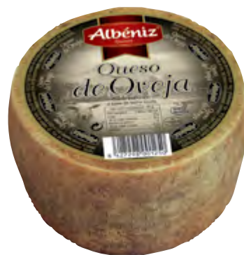
Queso mini de oveja 820 g.