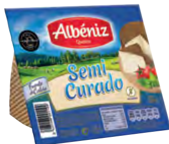
Cuña de queso semicurado 250 g. c/exp.

CÓDIGO: C183 EAN 13: 8427298004749 UNIDAD POR CAJA: 12