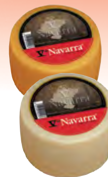
Queso mini oveja V Navarra ahum. 1,3 kg.

CÓDIGO: 94 EAN 13: 8427298002080 UNIDAD POR CAJA: 2