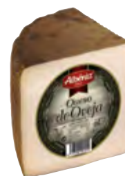
Queso de oveja curado 1/4 ± 800 g.

CÓDIGO: 212M EAN 13: 8427298004824 UNIDAD POR CAJA: 12