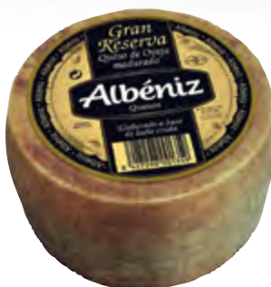
Queso mini de oveja Gran Reserva 1,2 kg.

CÓDIGO: 160 EAN 13: 8427298001311 UNIDAD POR CAJA: 2