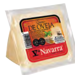
Cuña de queso oveja V Navarra nat. 250 g.

CÓDIGO: 92C2D EAN 13: 8427298002103 UNIDAD POR CAJA: 12