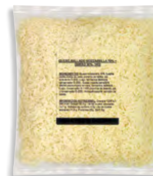
Rallado de Mozzarella 70% + queso 30% - 1 kg.

CÓDIGO: 239 EAN 13: 8427298003261 UNIDAD POR CAJA: 4