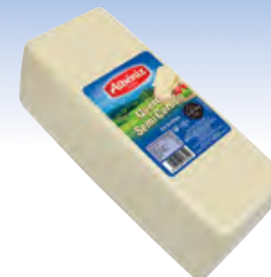
Barra de queso mezcla semicurado 3 kg.

CÓDIGO: 08A EAN 13: 8427298000444 UNIDAD POR CAJA: 6