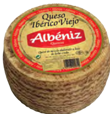
Queso ibérico viejo 3 kg.