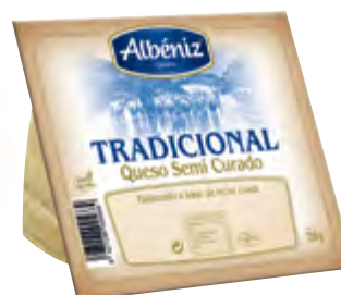
Cuña de queso tradicional semi curado 250 g.

CÓDIGO: 306 EAN 13: 8427298004312 UNIDAD POR CAJA: 6