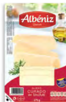
Lonchas de queso curado 175 g.

CÓDIGO: 154 EAN 13: 8427298002479 UNIDAD POR CAJA: 20