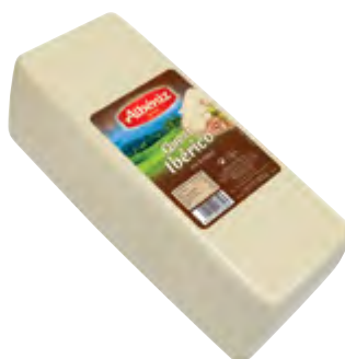
Barra queso ibérico 3 kg.

CÓDIGO: 401/4 EAN 13: 8427298000758 UNIDAD POR CAJA: 8