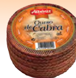
Queso mini de cabra 1 kg.

CÓDIGO: 74 EAN 13: 8427298000482 UNIDAD POR CAJA: 2