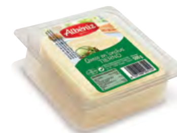
Loncheado de queso tierno bandeja 500 g.

CÓDIGO: L61 EAN 13: 8427298004664 UNIDAD POR CAJA: 16