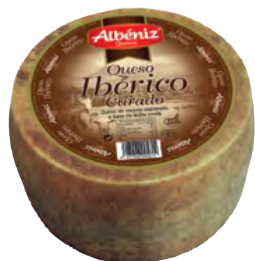
Queso ibérico curado 3 kg.