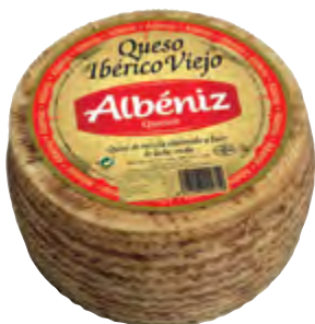
Queso ibérico viejo 3 kg.

CÓDIGO: 65 EAN 13: 8427298000765 UNIDAD POR CAJA: 4