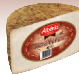
Queso mezcla curado 1/2 piezas ± 1,7 kg.

CÓDIGO: 211 EAN 13: 8427298002332 UNIDAD POR CAJA: 6