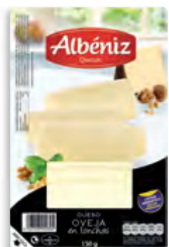
Lonchas queso de oveja 150 g.

CÓDIGO: C58 EAN 13: 8427298001427 UNIDAD POR CAJA: 12