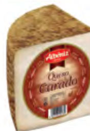
Queso mezcla curado 1/4 ± 800 g.

CÓDIGO: 211M EAN 13: 8427298004831 UNIDAD POR CAJA: 12