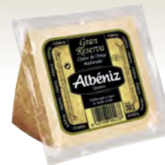
Cuña de queso oveja Gran Reserva 250 g.